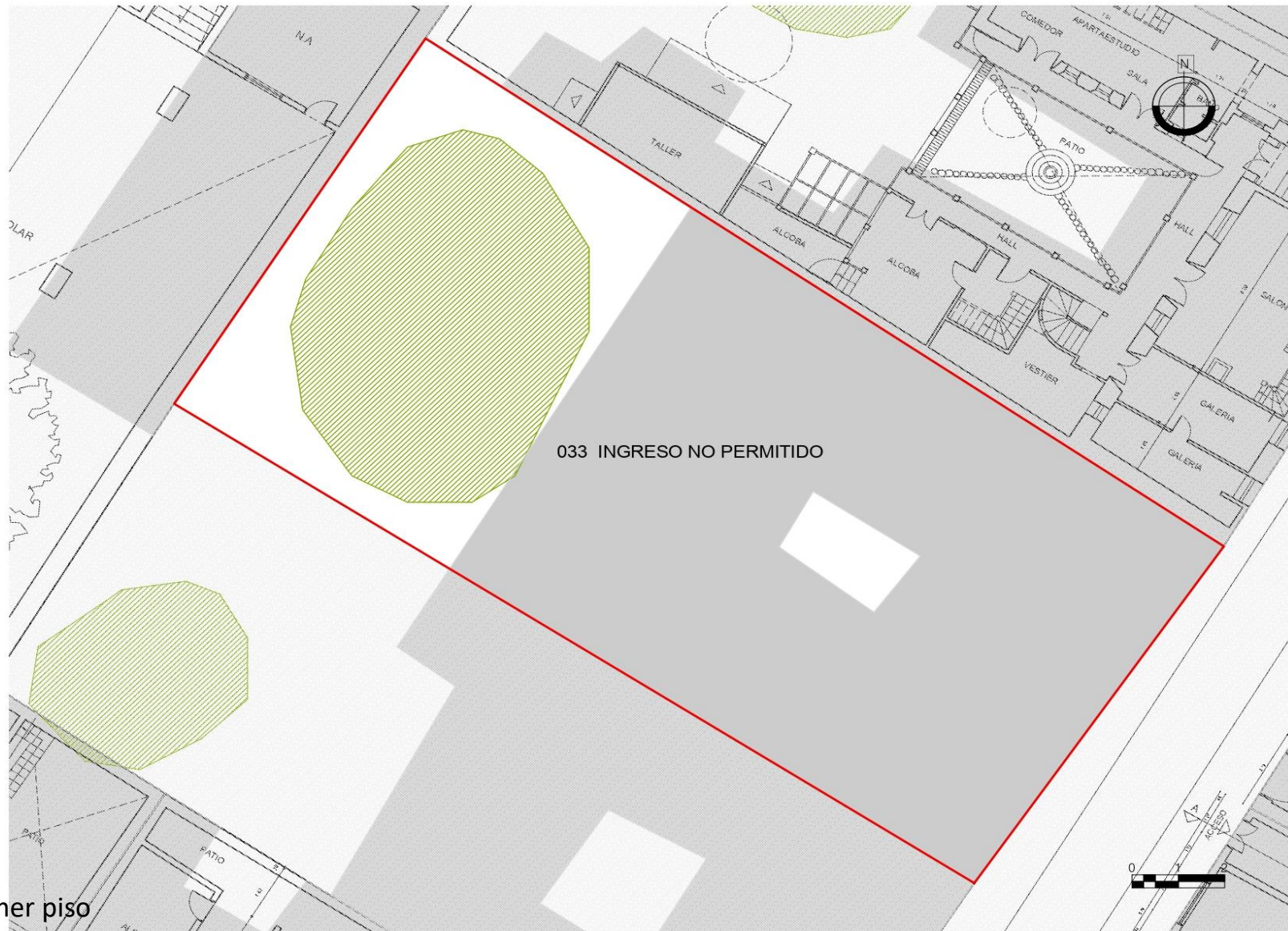
Planta primer piso